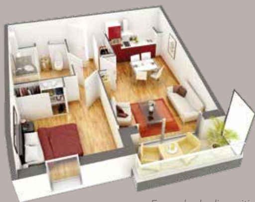
Exemple de disposition pour un appartement 2 pièces