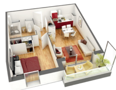
Exemple de disposition pour un appartement 2 pièces