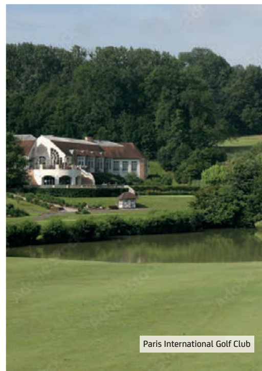
Paris International Golf Club

Bouffémont est un véritable havre de paix, offrant un équilibre parfait entre la tranquillité rurale et la proximité des commodités urbaines. Si vous recherchez un endroit où vous ressourcer, vous connecter à la nature et vivre une vie simple, Bouffémont vous attend avec sa beauté naturelle et son ambiance authentique.