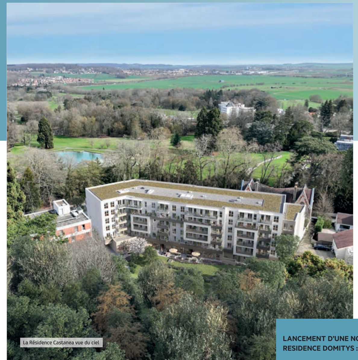
La Résidence Castanea vue du ciel

Plongez au cœur de Bouffémont et découvrez une résidence exceptionnelle qui vous offre bien plus qu'un simple logement.