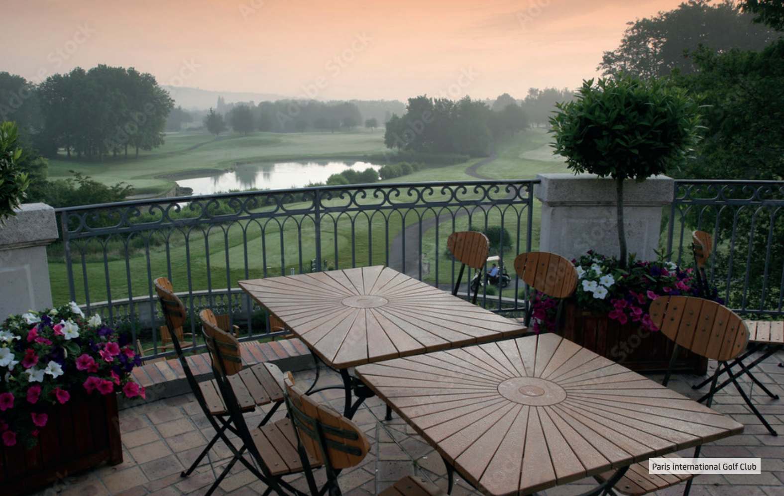
Paris International Golf Club